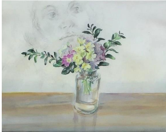
Blumen vor Gesicht, Aquarell, 1988

1990 Trotte Effingen („Sägemülitäli“) 1992, 21.11.–13.12., Galerie Alzbach Reinach; 1994, 18.11.–4.12., Arbeiten auf Holz, Im Spittel Küttigen. 1997 „150 Jahre Kloster Wettingen“ 2001 Jubiläumsausstellung im „Zehntenstock“ Oberflachs 2002 Singisenforum Muri 2003 „Im Notenschlüssel“ Aarau; 2008, 31.8.–28.9., Galerie im Schössli Gontenschwil.