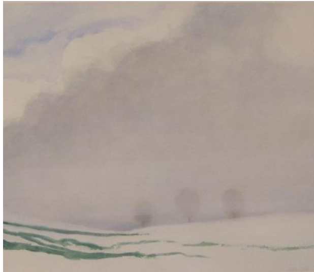
Lichtblick, Aquarell, 2006

Ruth Schweikert: Tage wie Hunde, Frankfurt 2019.